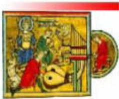
Conferenza Nazionale dei Direttori dei Conservatori di Musica