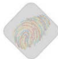
Conferenza Nazionale dei Direttori delle Accademie di Belle Arti